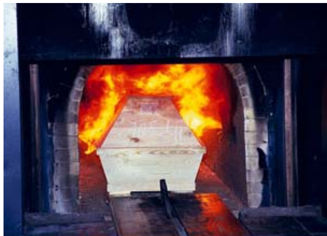
Feuerbestattung: Reinheitsgebot für die Totenasche?

„Wir dachten anfangs, vor allem Stadtmenschen werden besonders bläulich, weil sie sich ungesünder ernähren“, sagt Algordanza-Partner Andree. Die Vermutung erwies sich als falsch. Seitdem übernimmt Algordanza